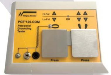
先進進口測試儀器PGT120.com

多樣化測試模式配置 測試時間1~2s 測試結果直觀 介面多樣化 可裝配於各類閘機內部