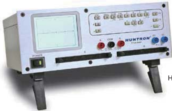
Huntron Tracker 3200S

最新的 Huntron® Tracker® 3200S 设计, 包括我们产品的历史和领先的电源断电测试, 主要在提供功能强大的测试和故障排除解决方案。