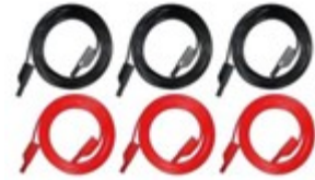
Jeux de câbles