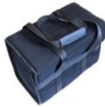
Sac pour le dispositif