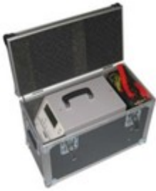
Coffre de transport