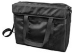
Sac pour câbles